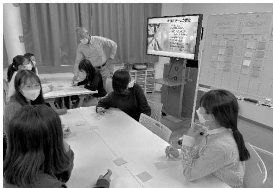
防災・減災に関するワークショップ(避難所課題解決ゲーム)の様子